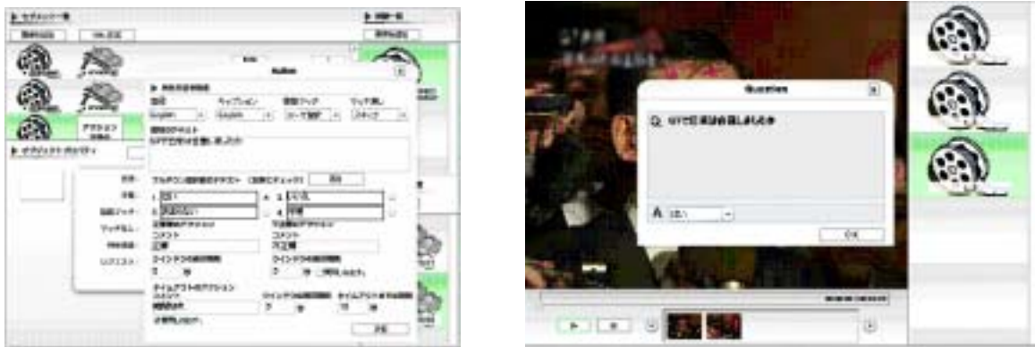
図3 (a) オーサリングプログラム

図3に、ニュースの教材化を例にした、オーサリングプログラムと再生プログラムの実行画面を示す。