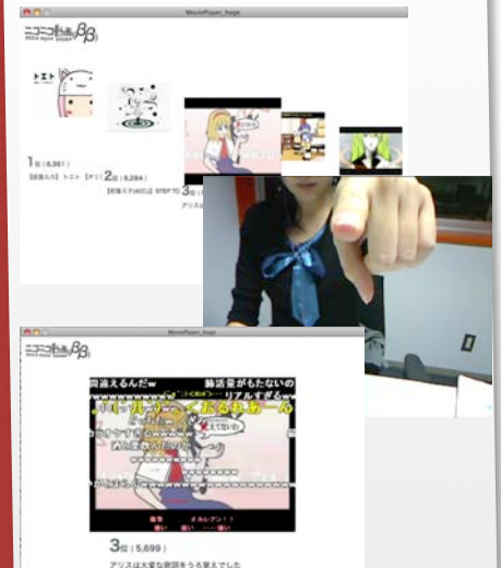
ムービープレイヤー