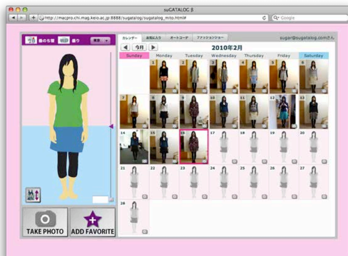
suGATALOGメイン画面の様子

suGATALOGは身だしなみを鏡で確認するタイミングを利用して、日々の自分の服装の写真を撮影し、それらの写真を合成することでパソコン上でコーディネートを行うシステムである。撮影した写真はアプリケーション上でカレンダー状に表示され、トップスとボトムスの二枚に切り分けて合成することで、着替えることなく手持ちの服のコーディネートを行うことができる。