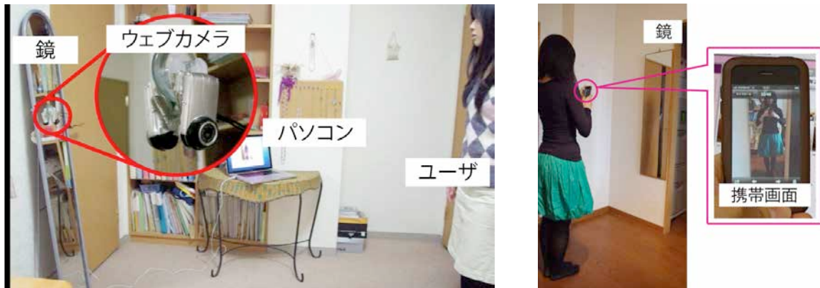
ウェブカメラで撮影する様子(左)/携帯のカメラで撮影する様子(右)

まず、アプリケーションの撮影画面で、部屋に設置したウェブカメラから服装の撮影を行う。または、携帯電話のカメラから写真を撮影し、ユーザごとに割り振られたメールアドレスに画像を添付して送信する。撮影した写真はアップロードされる。