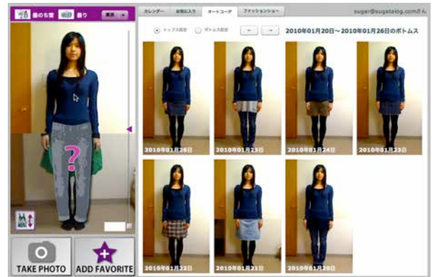
オートコーディネート機能

服を決めるとき「この服は絶対に着たい」など、片方だけ着る服が決まっている場合がある。そのようなとき、着たい服を試着室に表示させた状態でその服の上をクリックすると、その服に合わせたコーディネートが表示される。右図の例は、青いセーターを固定した状態でオートコーディネートを行った場合の例である。