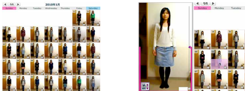
カレンダー機能 (左) /試着室機能(右)

アップロードされた写真は上図のようにカレンダー状に並ぶ。それぞれの写真はトップスとボトムスの二枚に切り分けられている。カレンダー上の写真の上半分をクリックするとカレンダー横の「試着室」のトップスがそれに変わる。ボトムスも同様である。それぞれの服のトップスは着丈位置が違うため、それをスライダーで調節して保存を行う。