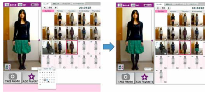
コーディネートプラン機能