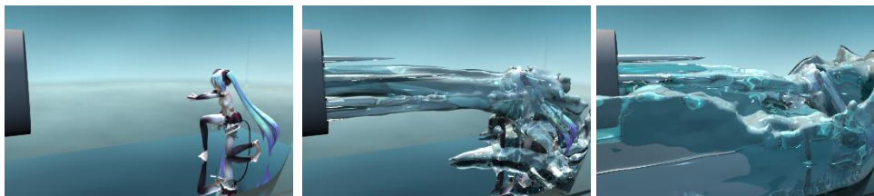
レイトレース＋流体シミュレーション