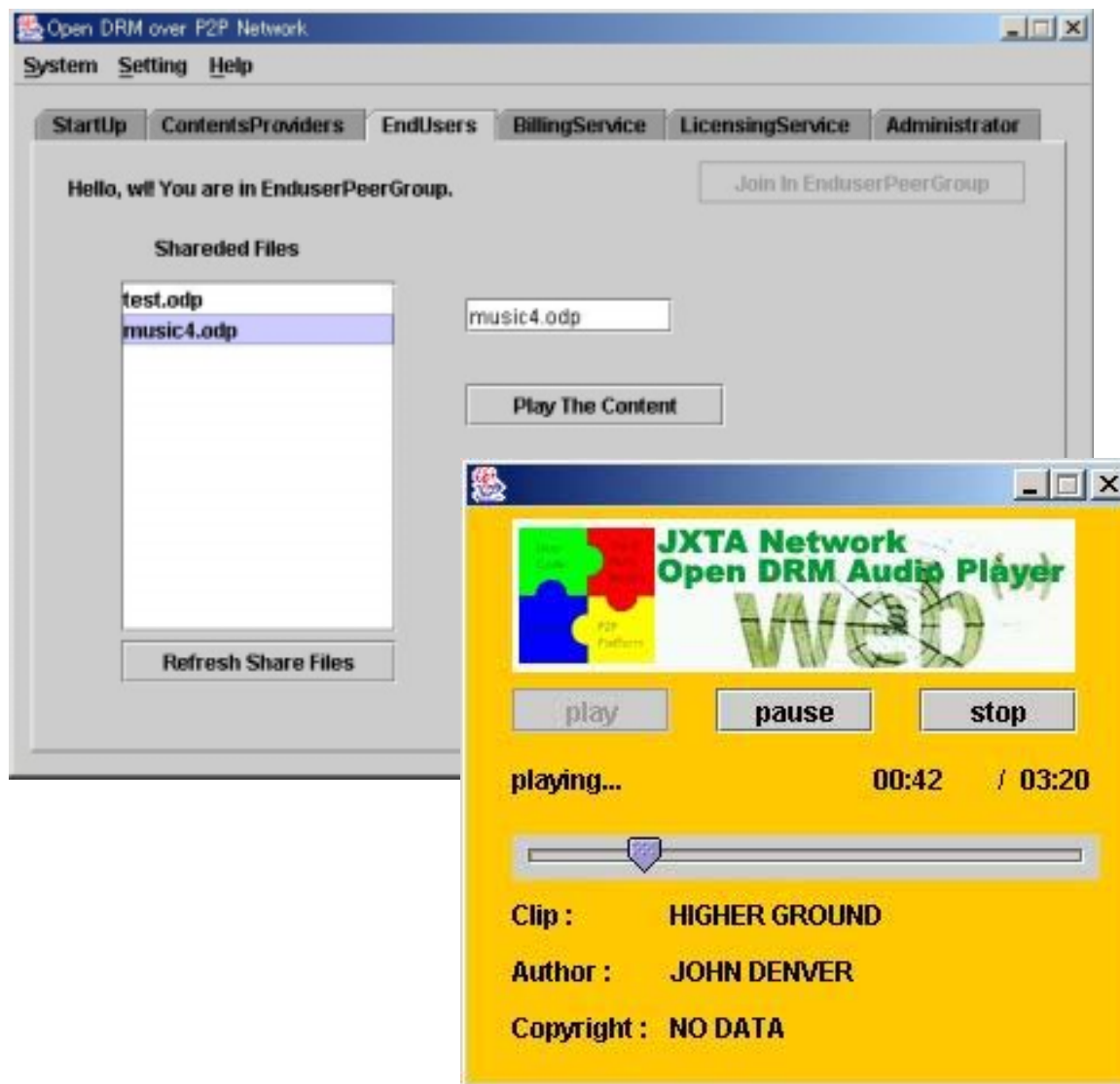
図 3 デモ画面イメージ (コンテンツ再生アプリケーション)